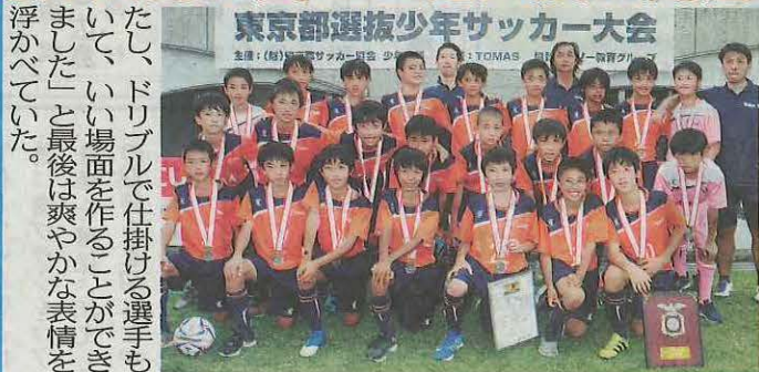
準優勝の第11ブロック選抜